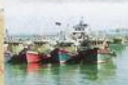
Jeli Kuala Besut