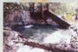
La Hot Spring