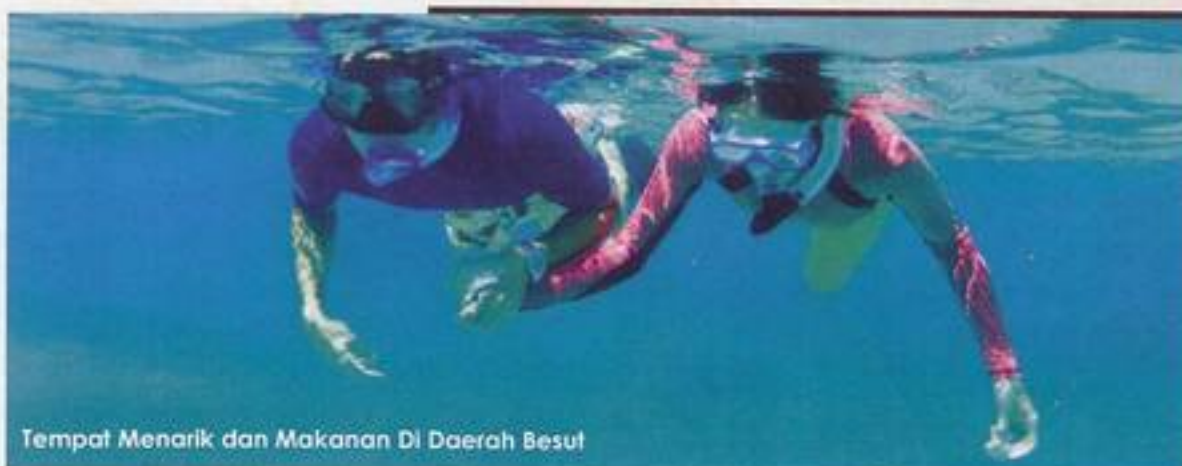
Tempat Menarik dan Makanan Di Daerah Besut